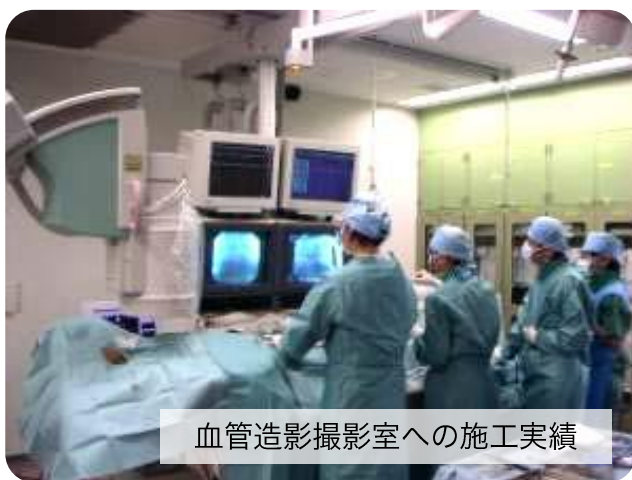
血管造影撮影室への施工実績